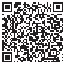
BACHELOR RESPONSABLE EN GESTION DES RESSOURCES HUMAINES