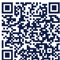
BTS GESTION DE LA PME